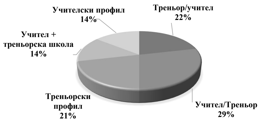
Фигура 2. Отговори на въпроса: „Какво образование притежавате?“

Изследваните 28 преподаватели са завършили, както следва: 6 от тях (21,4%) – първа специалност – Треньор по футбол / втора специалност – Учител по ФВС; 8 от тях (28,6%) – първа специалност – Учител по ФВС / втора специалност – Треньор по футбол; 6 от тях (21,4%) – само Треньорски профил; 4 от тях (14,3%) – само Учителски профил и допълнително обучение в Треньорската школа и отново 4 от тях (14,3%) – само Учителски профил (Фигура 2).