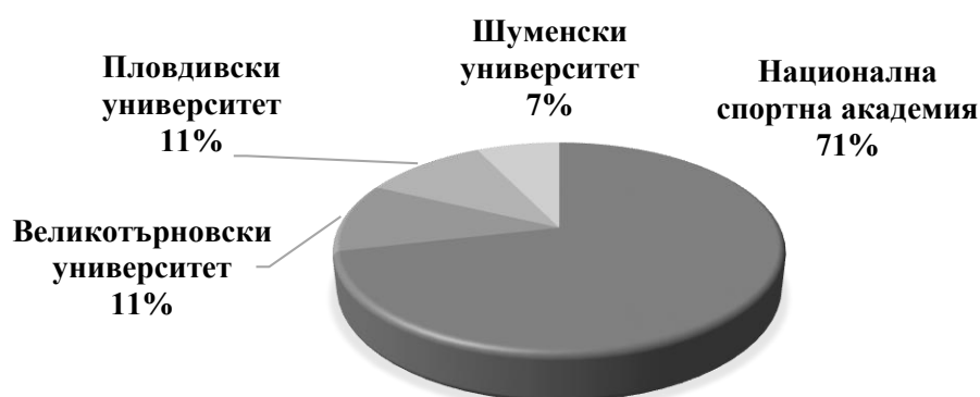
Фигура 4. Отговори на въпроса: „В кое висше училище завършихте висшето си образование?“

На въпроса: „В кое ВУ завършихте висшето си образование?“, 20 (71,4%) отговарят в НСА „Васил Левски“, 3-ма във ВТУ „Св. св. Кирил и Методий“ (10,7%) и ПУ „П. Хилендарски“ (10,7%) и двама (7,2%) в ШУ „Епископ Константин Преславски“ (Фигура 1).