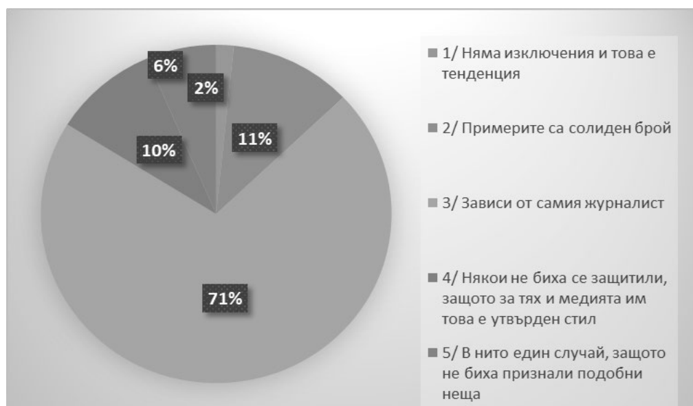
Фигура 3. Относителни дялове на журналистическа обосновка при липса на плурализъм

Когато се обобщава отсъствието на плурализъм при коментаторите и тяхната обосновка (Фигура 3), категорично на преден план излизат индивидуалните характеристики на дадения журналист. Според огромното мнозинство от респондентите (71%) това зависи от конкретния коментатор. Интерес представлява със своята категоричност и отговорът: „В нито един случай, защото не биха признали подобни неща“, даден от 6%.