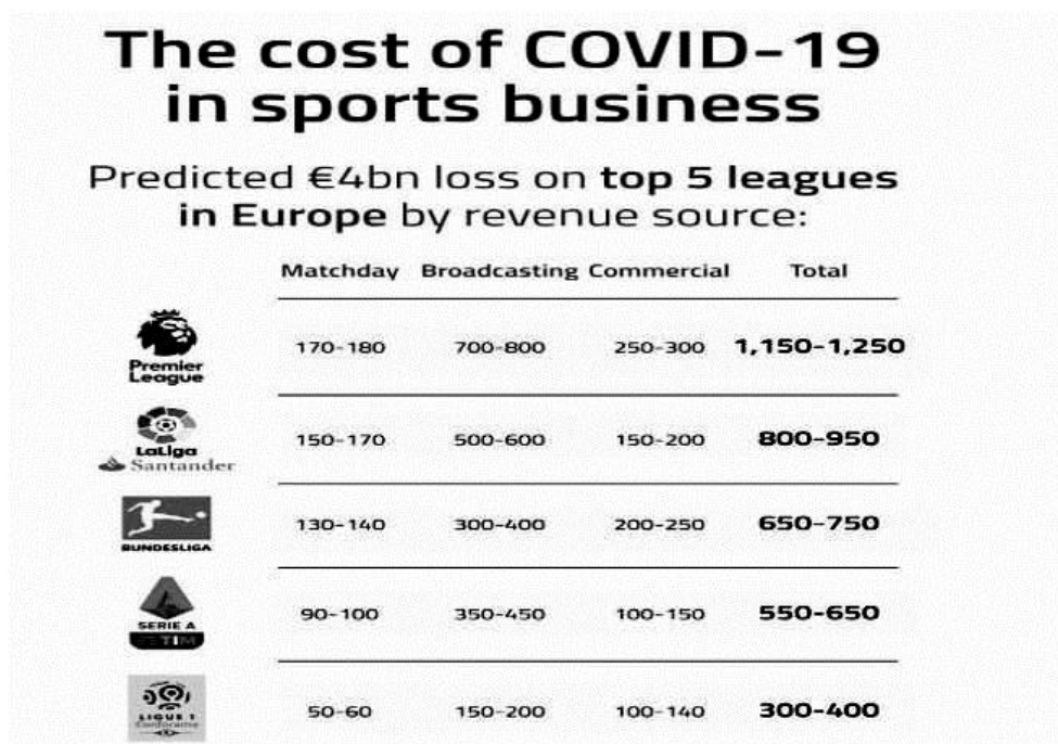
Фигура 2. Загуби на Европейски първенства от COVID-19